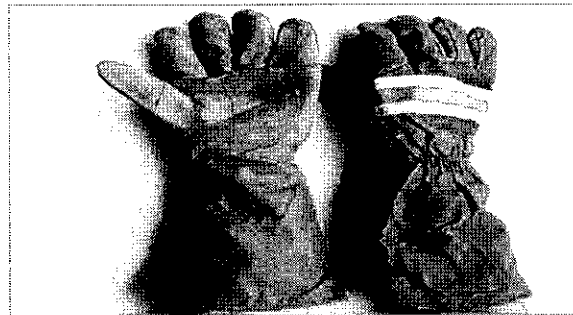
Imagen N° 01 Guantes de protección contra incendios