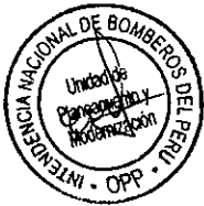
Imagen N° 04